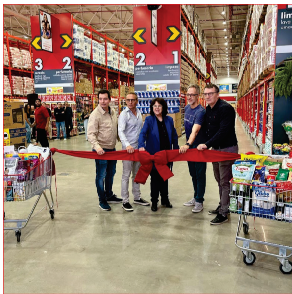
Vice-prefeita participou da pré-inauguração

Um dos principais reflexos imediatos da instalação da unidade foi a criação de 96 empregos diretos. São vagas que vão desde operadores de caixa até setores administrativos e de logística, impactando diretamente dezenas de famílias. O efeito vai além dos números formais.