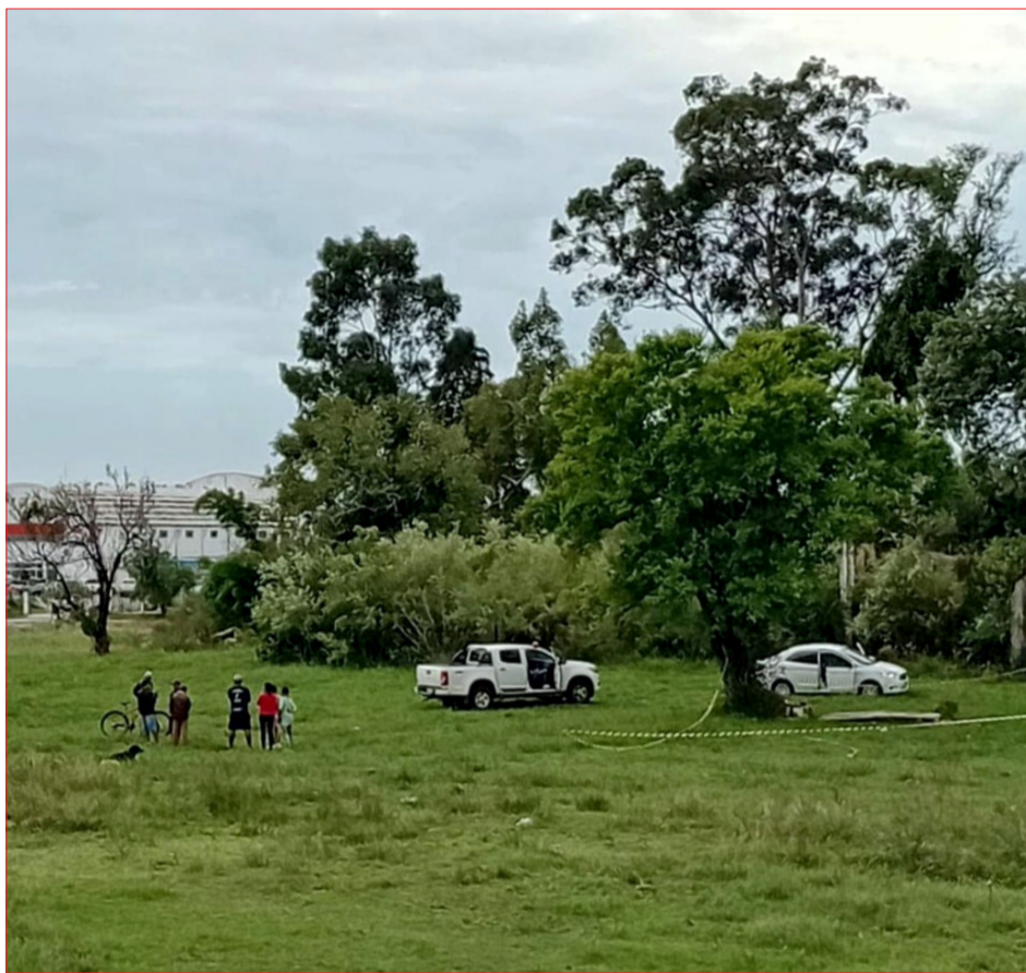
Homem foi morto em campo próximo a quadra de esportes