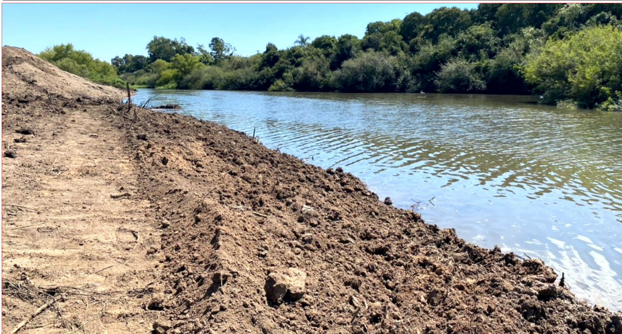
Trabalho foi concluído no final da primeira quinzena de abril; mais de 30 mil metros cúbicos de sedimentos das margens do rio

■ População ainda pode opinar pela internet