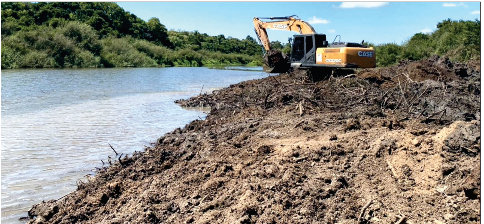
Projeto Desassorear foi realizado por meio de convênio entre a Prefeitura de São Gabriel e o Governo do Estado,

Implanon gratuito avança em São Gabriel, com atendimento organizado por prioridades